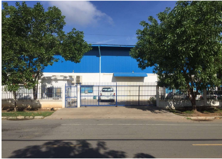
カンボジア第二工場