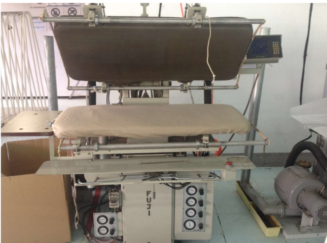
エレ・クール設備(形態安定・帯電防止加工)