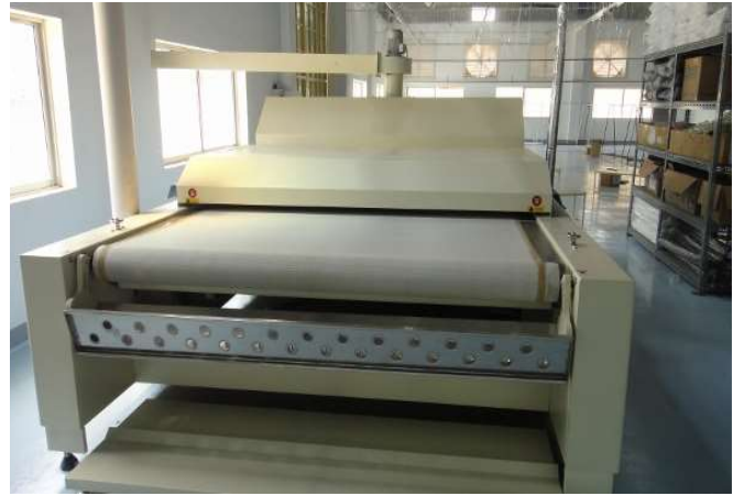
縮絨機(スポンジング)