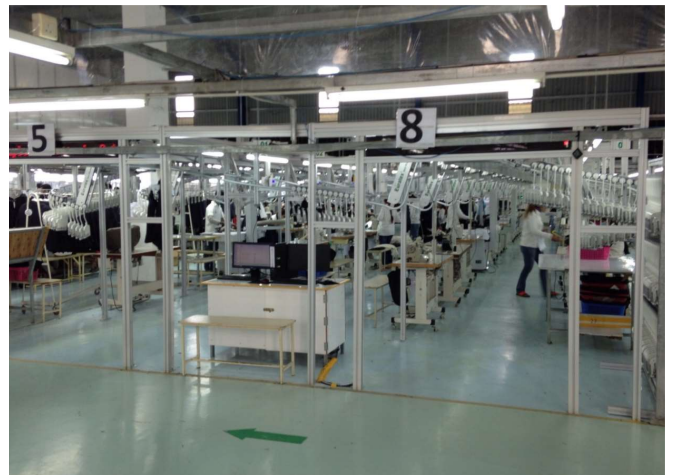
縫製ライン ハンガーシステム