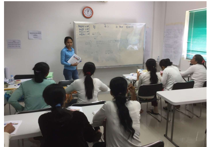
クメール語(カンボジア語)Bクラス