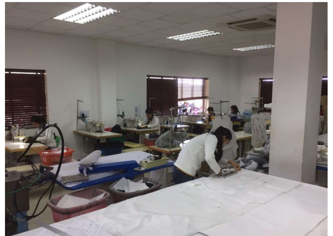
技術課(サンプルライン)