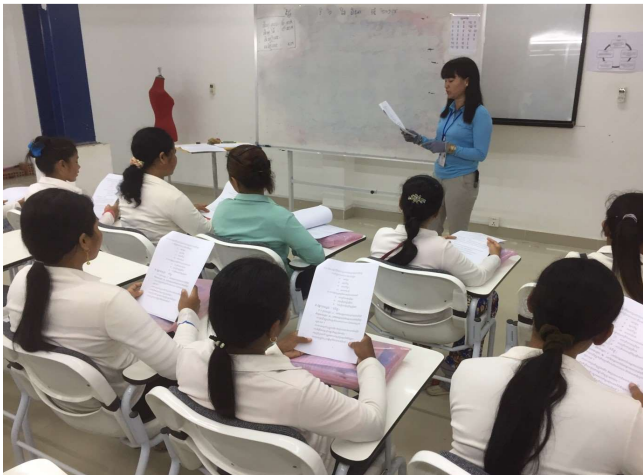
クメール語(カンボジア語)Aクラス